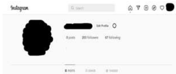
Primjer zastićenog profila

GLAVNI DIO (25 min)- U razradi sata se pokazuje primjer privatnog(zaštićenog profila), i informacije koje se mogu doznati iz njega. To uspoređujemo sa ne zaštićenim profilom pomoću kojeg se mogu doznati razne informacije o korisniku. Također važno je napomenuti da bi samo osobe starije od 13godina mogle imati svoje račune na društvenim mrežama, ako je osoba mlađa od 13godina I ima račun na društvenoj mreži pokazali bi preko primjera kako zaštititi taj profil I spriječiti razne aktivnosti drugih korisnika. Učenici bi preko prezentacije u PowerPointu naučili kako zaključati profil i osigurali privatne informacije.