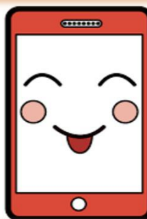
Primjer plakata 2.grupe

PROVJERI I AUTORA ČLANKA (danas svi imaju pristup internetu i mogućnost objavljivanja)